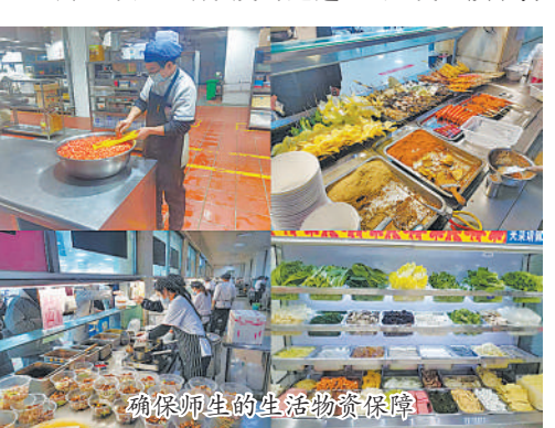
确保师生的生活物资保障

学校高度重视学生的心理疏导,坚持做到指导帮扶“不掉线”,开通线上心理咨询及紧急心理援助热线,共接待学生线上心理咨询27人次,接待电话紧急心理援助10人次,开展3场《疫情期间心理健康调适》线上主题讲座。