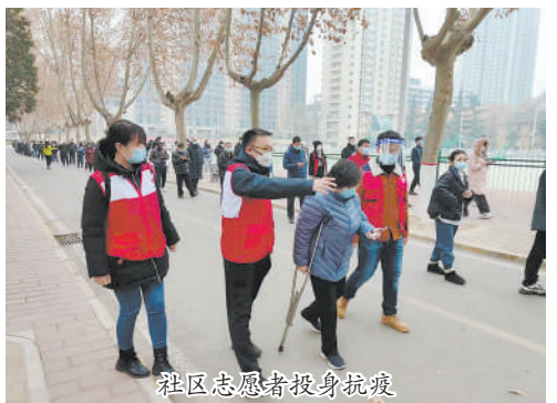
社区志愿者投身抗疫

疫情期间,学校坚持“停课不停学”,印发《关于调整本学期期末考试及相关教学工作的通知》和制定相关应急预案。2022年1月4日,2021-2022学年春季学期线上教学工作正式启动。全校本科教学应开设1806个课堂,实际开设1797个课堂,开课率达99.5%,做到了“应开尽开”。