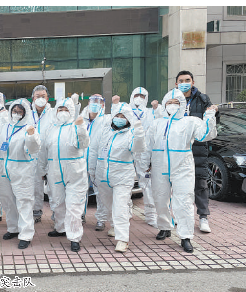
确保师生的生活物资保障

根据学校疫情防控总体要求,由人事处牵头,各单位联络员组成教职工健康监测和管理工作组,承担全校在职教职工及其同住人员、租住户、校聘临聘人员及其同住人员的健康监测和管理工作,形成了“指挥部——工作团队——教职工”的三级联动工作机制,努力做到底子清、情况明,确保“一人一案”建好台账,以实事求是作