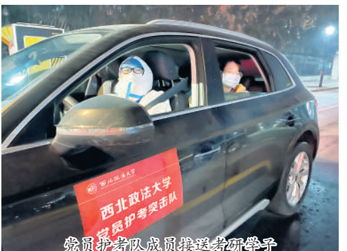
党员护考队成员送考研学子

伟大的精神产生伟大的力量。在这场抗疫斗争过程中,西法大人将“老延安”优良传统和伟大抗疫精神相结合,和伟大建党精神相结合,在红色基因中注入了时代力量,在磨难中淬炼了优秀品格,积累了重要经验,收获了深刻启示。我们要把这种精神融入到“立德树人”全过程,把战“疫”成果转化为“奋进新征程、建功新时代”的实际行动,让弥足珍贵的精神资源在新征程路上展现出强大的感染力和号召力,绽放出璀璨的时代光芒,成为西法大人踔厉奋发、笃行不怠的不竭源泉。