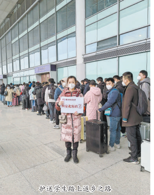
护送学生踏上返乡之路