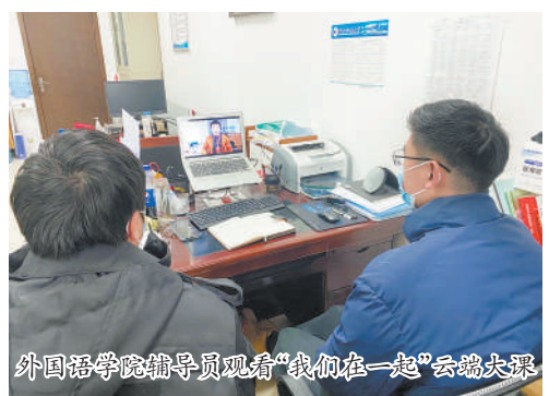
外国语学院辅导员观看“我们在一起”云端大课

艰难困苦,玉汝于成。习近平总书记强调,疫情防控是一场保卫人民群众生命安全和身体健康的严峻斗争。西北政法大学党委和行政坚决贯彻党中央、省委决策部署,按照省委教育工委、省教育厅工作要求,坚持把师生生命安全和身体健康放在第一位,着力抓实抓细抓各项防疫防控工作。领导干部靠前指挥,强化担当;广大党员冲上一线,守土有责、守土担责、守土尽责,竭尽全力做好疫情防控每一项工作、每一个环节;近300名教职工志愿者、1400余名学生志愿者、100余名退休教师及社区志愿者投身抗疫,“志愿红”和“天使白”以生命赴生命、以平凡铸伟大,成为这个冬天最美的颜色。