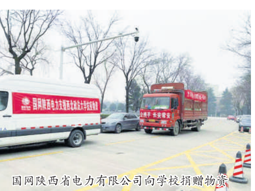
国网陕西省电力有限公司向学校捐赠物资