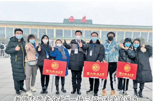
教师志愿者奔赴“一场三站”送学子返乡