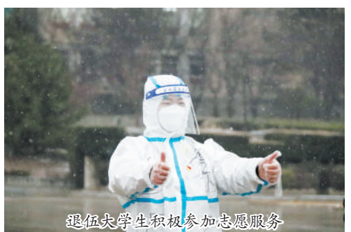
退伍大学生积极参加志愿服务

沧海横流,方显英雄本色。面对严重疫情,全体西法大人在伟大抗疫精神的激励和鼓舞下,坚持和弘扬“艰苦奋斗”的“老延安”优良传统,咬紧牙关、屏息聚力,不怕苦、不畏难,众志成城、共克时艰,激荡出“不破楼兰终不还”的铿锵旋律。