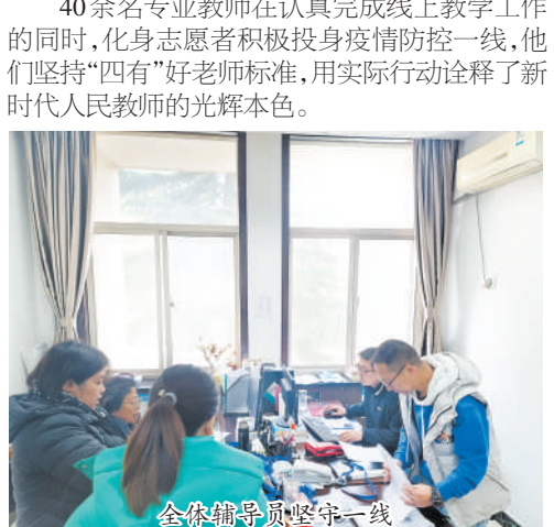
全体辅导员坚守一线

40余名专业教师在认真完成线上教学工作的同时,化身志愿者积极投身疫情防控一线,他们坚持“四有”好老师标准,用实际行动诠释了新时代人民教师的光辉本色。